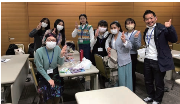
アースデイ鎌倉 10月30日 鎌倉芸術館

地域の市民活動グループによる「アースデイ鎌倉」や「SDGs セミナー」などの市民イベントにおいて難民に関する講義やアピールを行うことで、地域の人々に難民について知っていただく機会となりました。