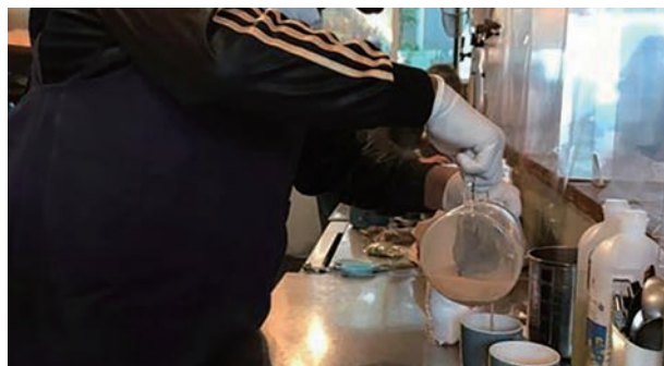
10月31日 まちの社員食堂 スリランカのRさんがつくるミルクティー