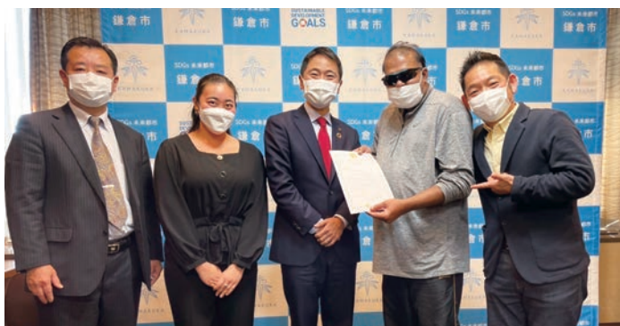
写真中央、松尾 崇 鎌倉市長 (2022年1月20日、鎌倉市役所)

2022年1月20日「SDGs 未来都市」を掲げる鎌倉市とクルッポを運営するカヤックが企画した「クルッポアワード 2021」で「SDGs 部門賞」をいただきました。「特に大きく SDGs の達成に貢献し、ひと・まち・地球に嬉しい体験を通して、つながりを増やしたスポット」として表彰されました。